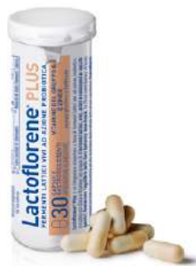
LACTOFLORENE PLUS 30 capsule