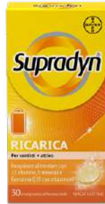
SUPRADYN RICARICA 30 compresse effervescenti