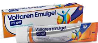
VOLTAREN EMULGEL 2% gel tubo da 60 g