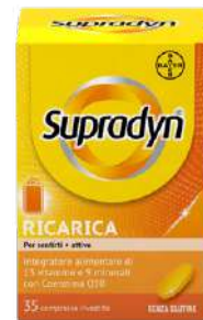
SUPRADYN RICARICA 35 compresse effervescenti