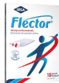
FLECTOR 180 mg 10 cerotti medicati