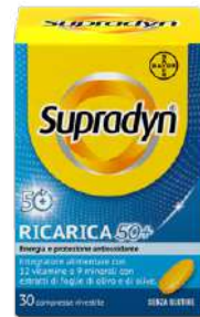
SUPRADYN RICARICA 50+ 30 compresse effervescenti