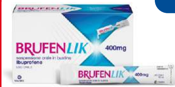
BRUFENLIK 400 mg 20 bustine da 10 ml