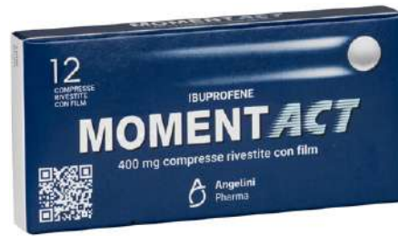
MOMENTACT 400 mg 12 compresse rivestite