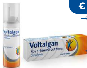
VOLTALGAN 3% SCHIUMA CUTANEA 50 g