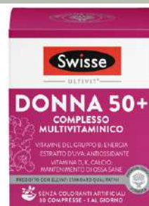
SWISSE MULTIVITAMINICO • Donna 50+ 30 compresse • Uomo 50+ 30 compresse