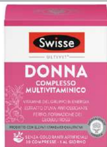
SWISSE MULTIVITAMINICO DONNA 30 compresse