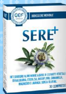
SERE+ CON ESTRATTI DI VALERIANA, PASSIFLORA 30 compresse

CONTINUA LA PROMOZIONE DI DICEMBRE VALIDA FINO AL 31 GENNAIO 2025