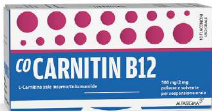
COCARNITIN B12 500 mg/2 mg 10 flaconcini da 10 ml