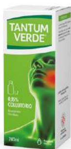
TANTUM VERDE 0,15% COLLUTORIO 240 ml