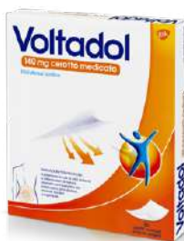
VOLTADOL 140 mg 10 cerotti medicati