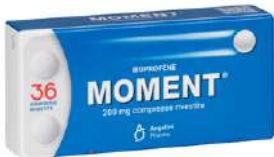
MOMENT 200 mg 36 compresse rivestite